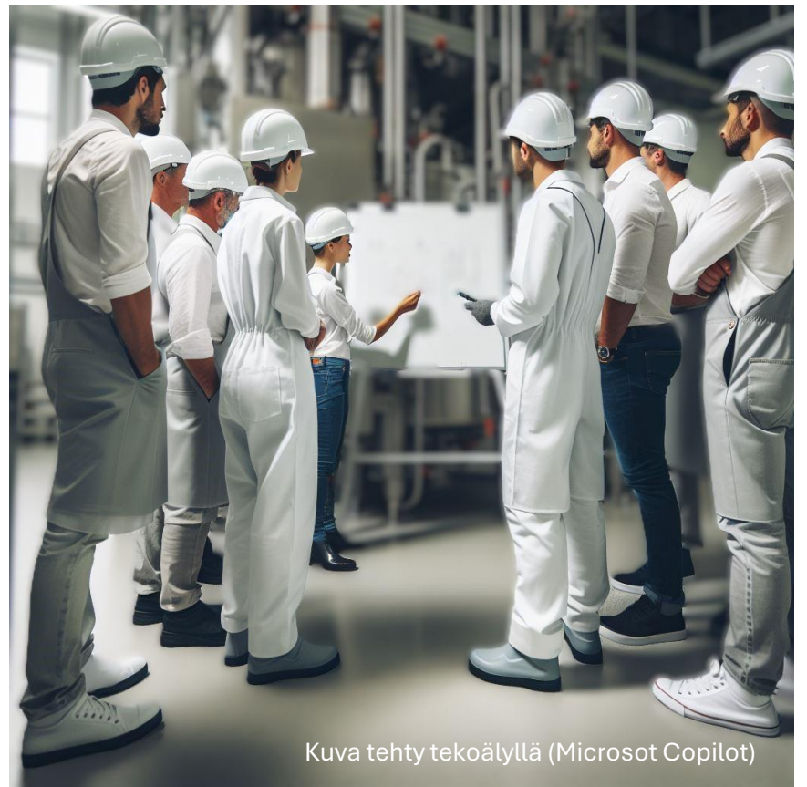
Kuva tehty tekoälyllä (Microsoft Copilot)

Turvallisuudesta puhuminen lisää tietoisuutta ja turvallisuushavaintojen määrää. Työntekijöiden mahdollisuus osallistua keskusteluun on tärkeää.