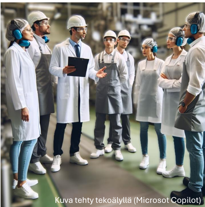
Kuva tehty tekoälyllä (Microsoft Copilot)

Yleisesti turvavartteja pidetään ensisijaisesti esihenkilöiden turvallisuusjohtamistyökaluina, mutta joissakin organisaatioissa turvavartteja pitävät myös esimerkiksi työsuojeluvaltuutetut ja muut turvallisuudesta kiinnostuneet työntekijät. Tyypillisesti turvavarttiin osallistuvat jonkin osaston, vuoron tai tiimin kaikki työntekijät. Hyvin toteutetussa turvavartissa keskustelulla on olennainen rooli, ja esihenkilöt saavat palautteen lisäksi tietoonsa muun muassa turvallisuuteen liittyviä ongelmia ja kehityskohteita. Monesti esihenkilöt oppivat itsekin turvallisuudesta ja olisi hyvä, että haastavimpiin kysymyksiin esihenkilöille olisi tukea saatavilla.