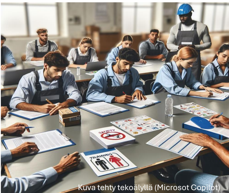
Kuva tehty tekoälyllä (Microsoft Copilot)

SafeFI-hankkeen kotisivuilta https://projects.tuni.fi/safefoodindustry