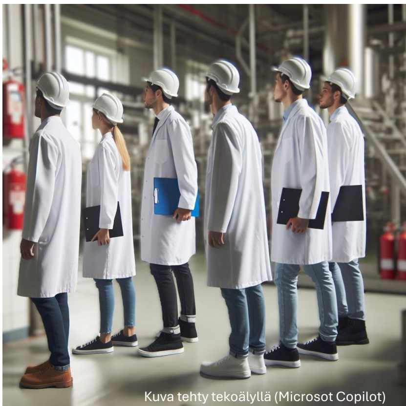
Kuva tehty tekoälyllä (Microsoft Copilot)

Kierroksen vetää työsuojeluvaltuutettu tai osaston työsuojeluasiamies. Kierrokselle osallistuu kerrallaan 2–6 kohteen työntekijää.