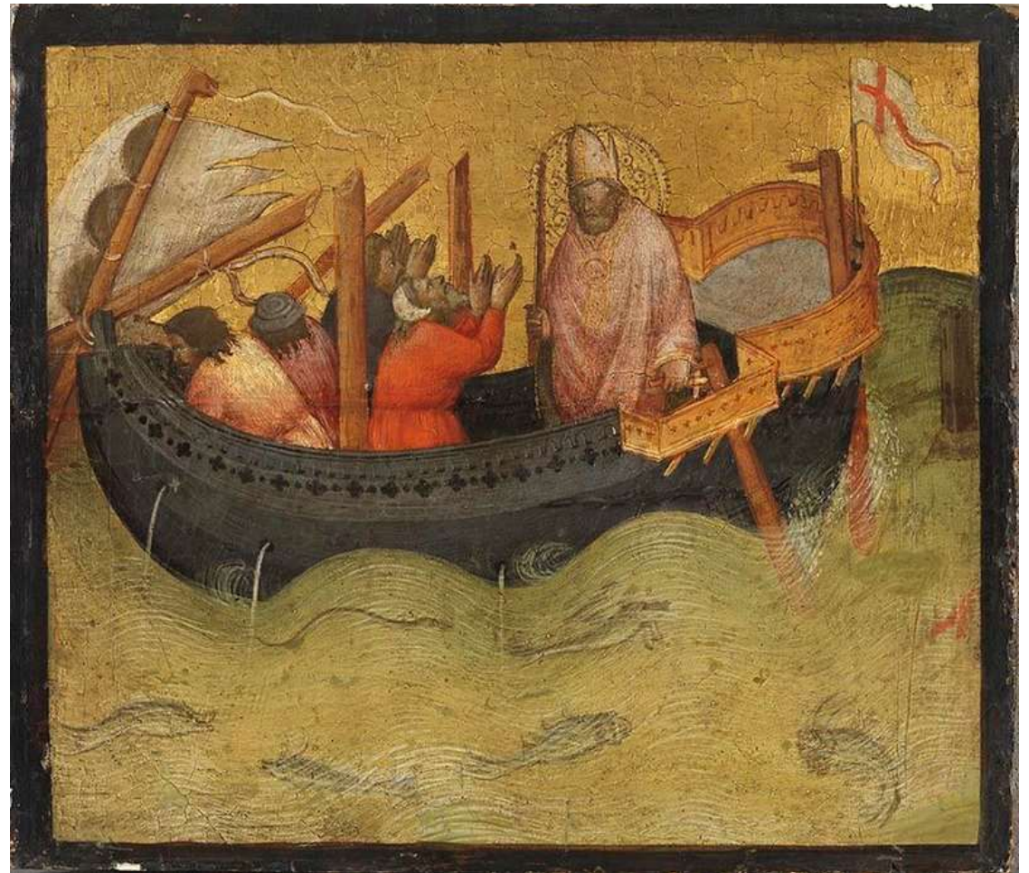
Kuva 1: St Nicholas saves a ship in a storm (Agnolo Gaddi, ca. 1393-1396)

LISÄTYÖKALUJA PAIKKATIETOASIAANTUNTIJOILLE SEKÄ KULTTUURIYMPÄRISTÖJEN PARISSA TYÖSKENTELEVILLE