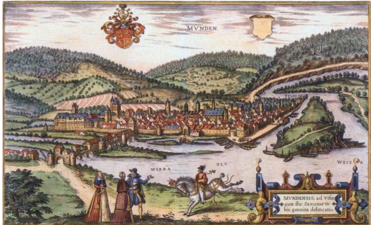
Kuva 4: View of Hann. Münden by Franz Hogenberg (1584). The town was an important staple market, where commodities were transhipped between vessels sailing on the Weser, Fulda and Werra rivers.