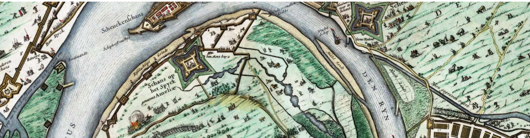
Kuva 2: The Schenkenschans situated between the Waal and the Rhine on a map with the situation around 1635 made by J.J. Schot, 1649, Atlas van Loon.