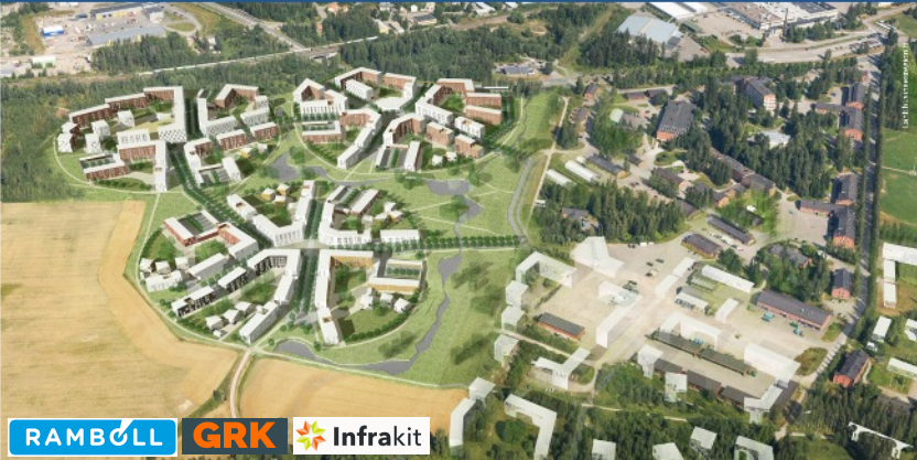
■ Lahti: Laadunosoituksen toimintamalli, case Hennala