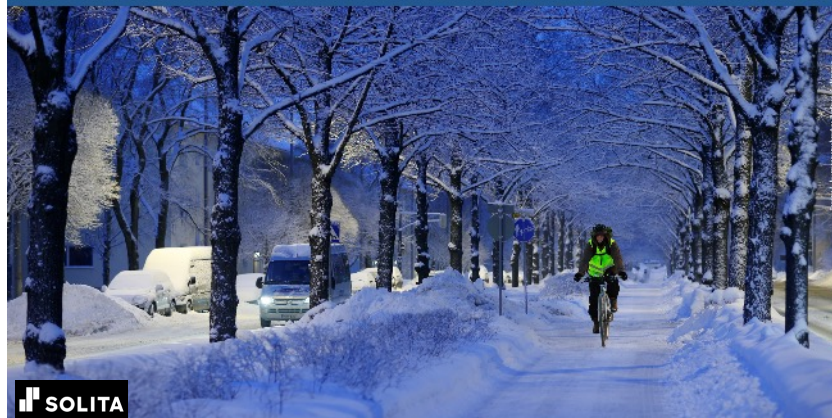
■ Oulu: Kunnossapidon toiminnanohjauksen kehittäminen