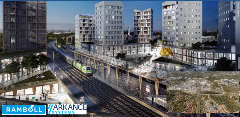
■ Espoo: Aluekehityksen tilannekuva, case Kera