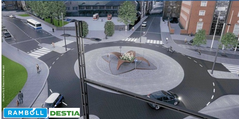
■ Tampere: Kahden viikon katuhanke, case Satakunnankatu