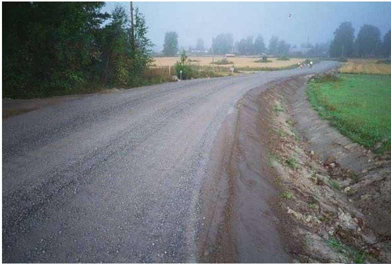
Valmis tie, jyrsinstabilointi