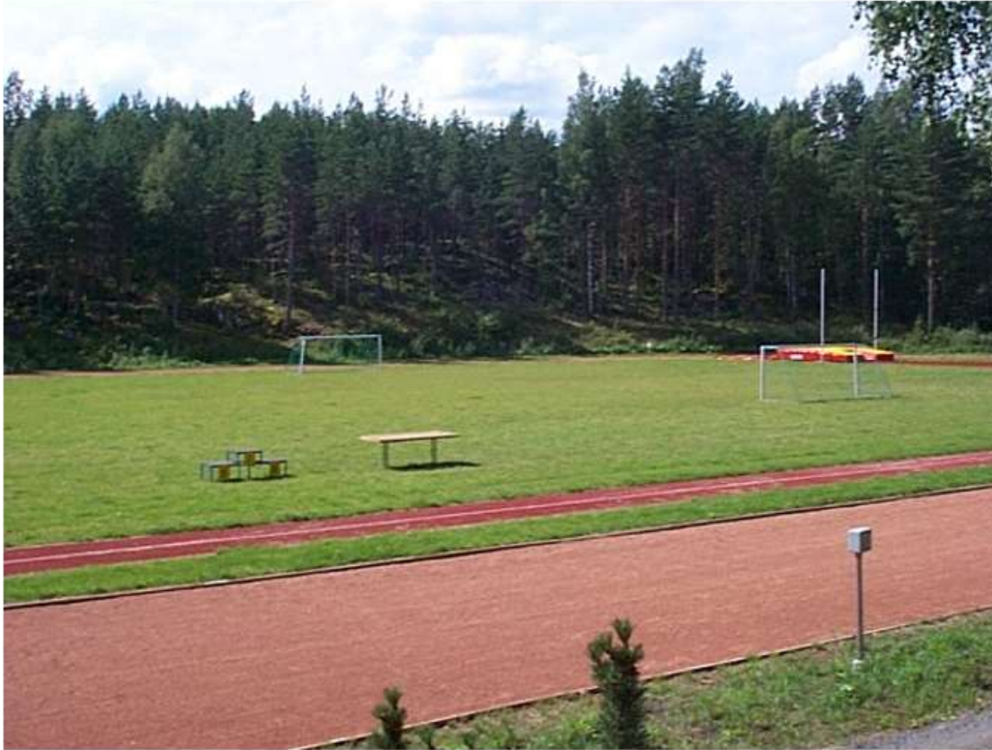
Luopioisten urheilukenttä peruskorjauksen jälkeen