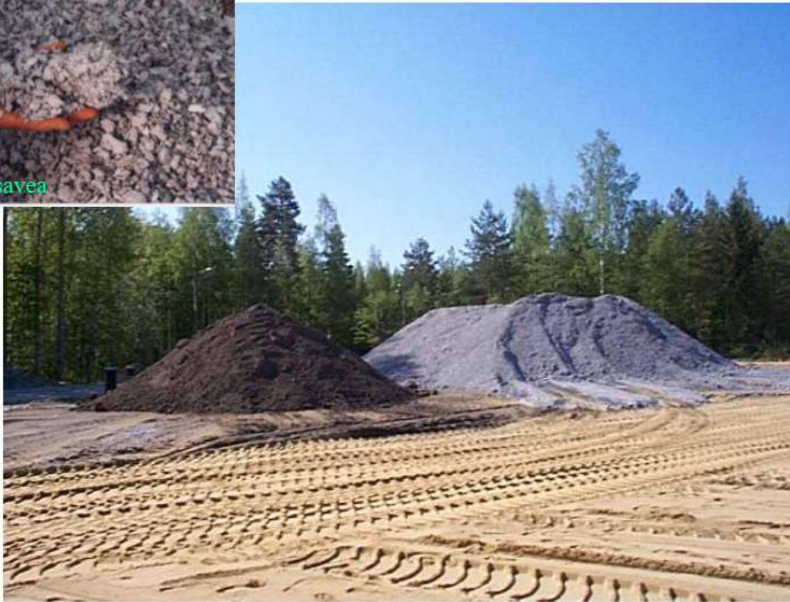
Tuhkaa ja kuitusavea varastokasoilla (Luopioinen v. 2000)