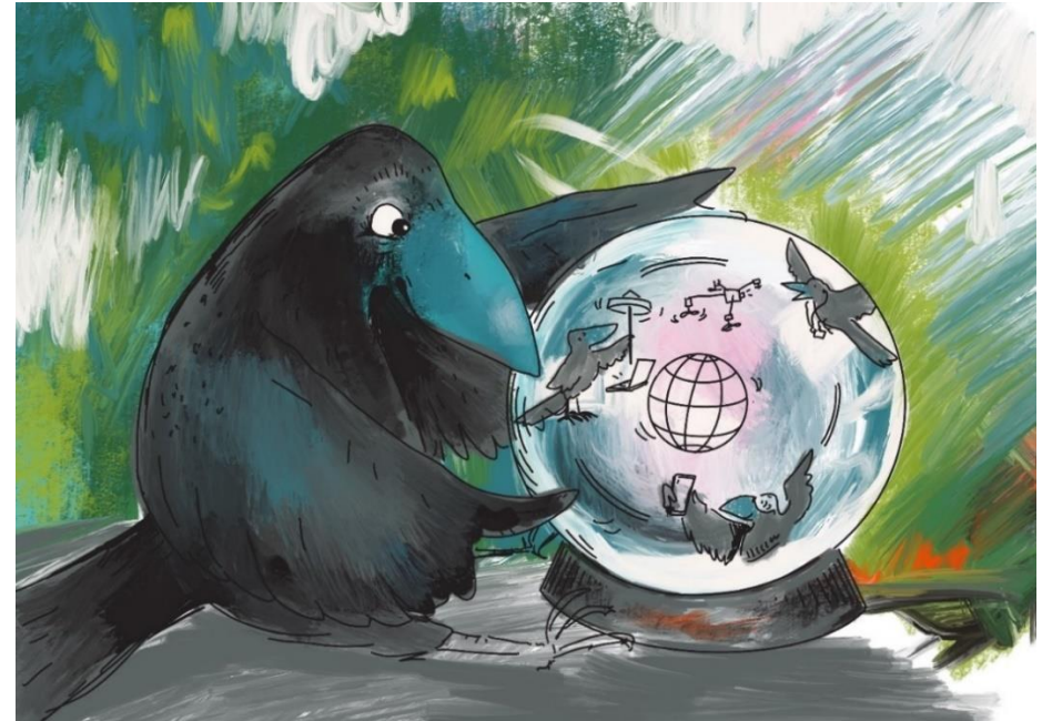
Kuvitus: Salla Lehtipuu

Kulttuurialan pitäisi yhdistää voimansa edistääkseen kulttuurikritiikin ylläpitämistä ja kehittämistä esimerkiksi koulutuksen keinoin. Kulttuurin jatkuvuuden kannalta taiteen alan laadukkaiden tekstien ylläpitäminen on keskeistä ja ammattikritiikin avulla kyetään näiden tekstien jatkuvuutta ylläpitämään. Projekteja ammattimaisen kulttuurialojen kritiikkityön ylläpitämiseksi ja tukemiseksi on suunniteltu, mutta on todennäköistä, että ettei mikään yksittäinen taho pysty yksinään asiaa edistämään. Kulttuurialan organisaatioiden yhteistyönä sillä on paremmat mahdollisuudet onnistua. Alustat voivat mahdollistaa kritiikin kokoamisen, ylläpitämisen ja kehittämisen, vaikka sittenkin haasteena on kritiikkityön ansaintalogiikan hauraus.