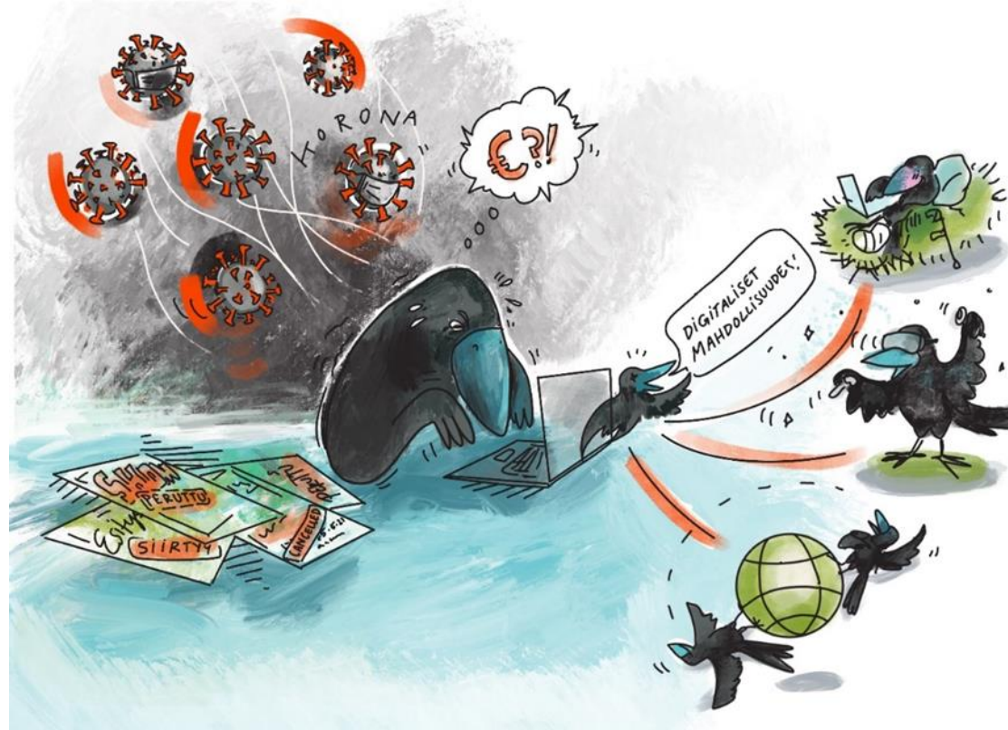
Kuvitus: Salla Lehtipuu

Koronapandemian aikaan saama, digiloikkaisiin kutsuttu hurja teknologiavälitteisyyden lisääntyminen näkyi myös tapahtuma- ja kulttuurialan työssä, ainakin pandemia-aikana. Erilaiset virtuaalialustat, kuten zoom, teams ja jitsi tulivat hyvin tutuiksi, kun niitä käytettiin lähes päivittäin kommunikaation välineinä. Alustojen kautta järjestettiin palaverreja ja koulutuksia, sekä verkostoiduttiin, mutta myös esiinnyttiin, harjoiteltiin sekä ohjattiin näytelmiä tai esimerkiksi ryhmäliikuntaa. Liikunnan opetusta striimin kautta tarjonneet