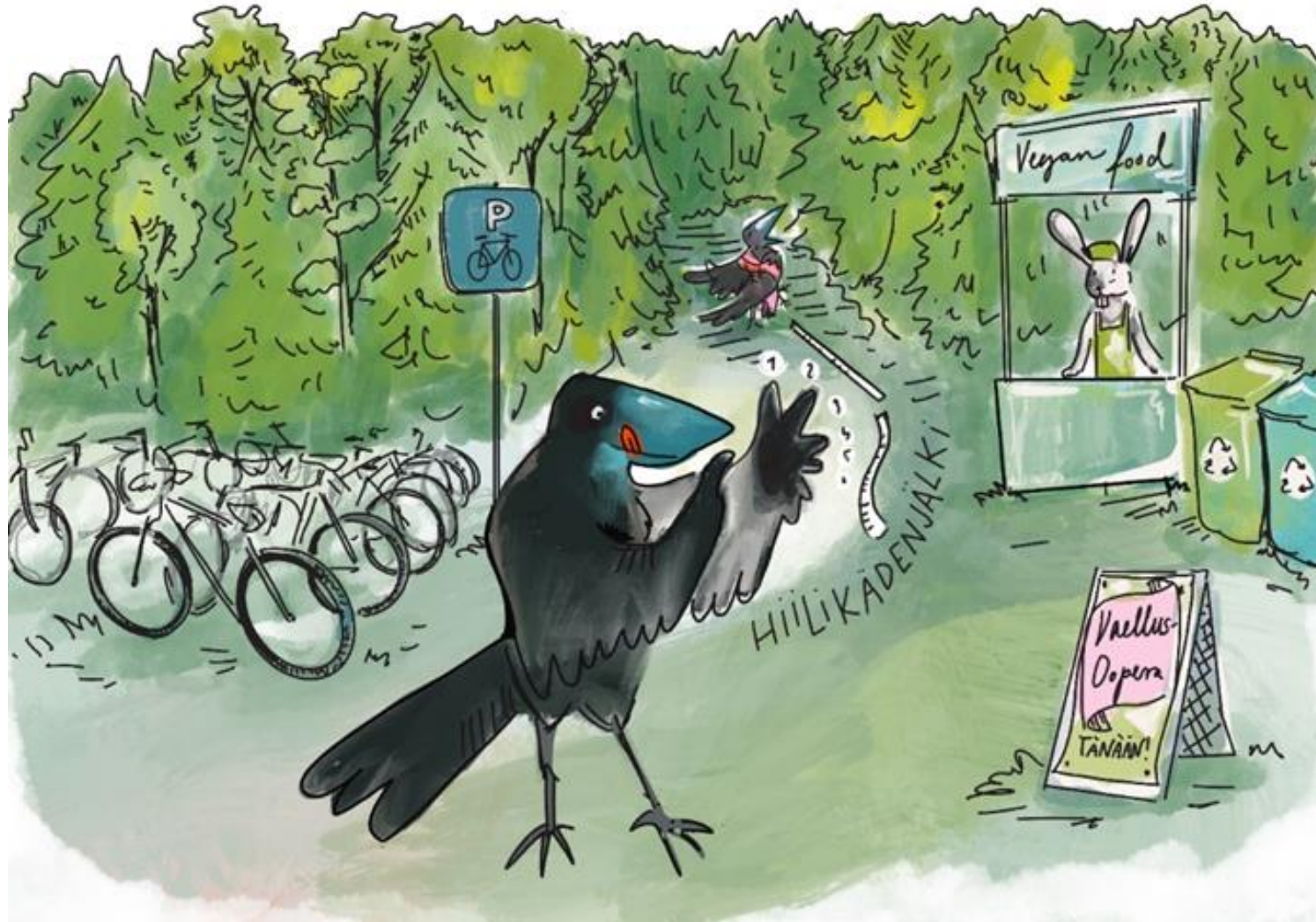
Kuvitus: Salla Lehtipuu