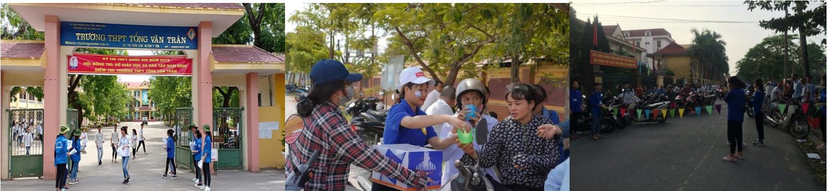
Supporting to entrance exam