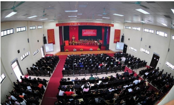
Meeting hall (400 seats)