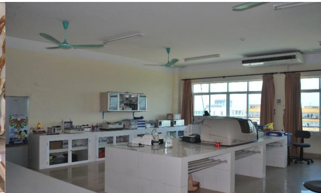
Pratice Room & Labs