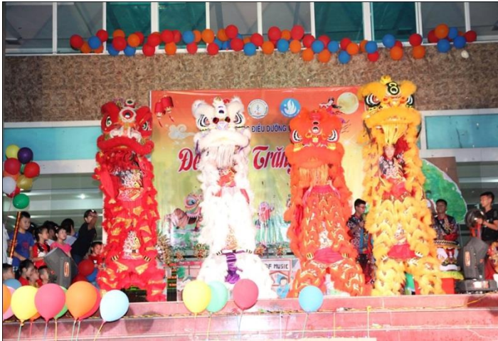
Mid – Autumn Festival