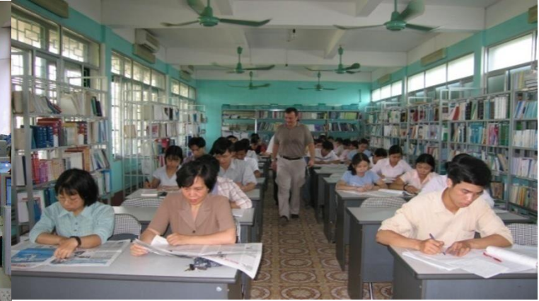
Library (600m 2 )