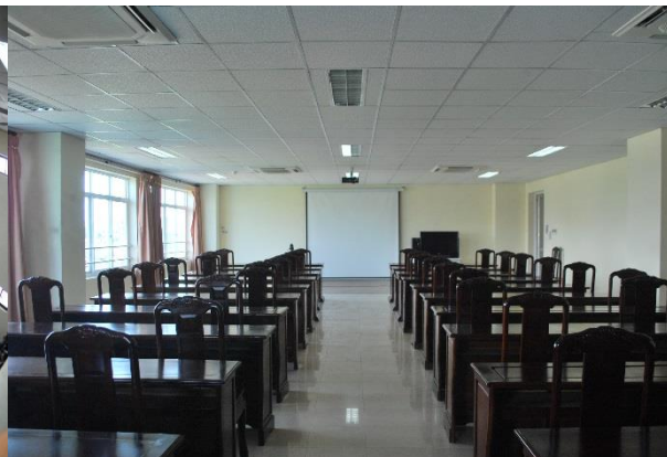
Conference rooms (3 x 100 seats)