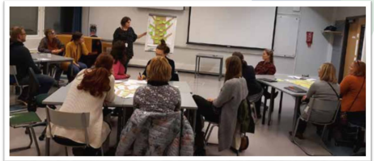
Terveystenhuollon ammattilaisille ja 3. sektorin toimijoille järjestetyn Maahanmuuttaja terveydenhuollossa –koulu-tuksen Learning Cafe –työskentelyä (Tutta Tanttari)